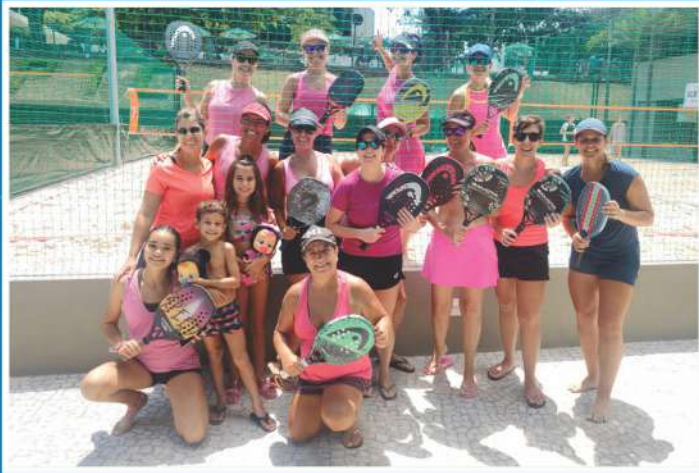
Estreia do Espaço Beach Tennis